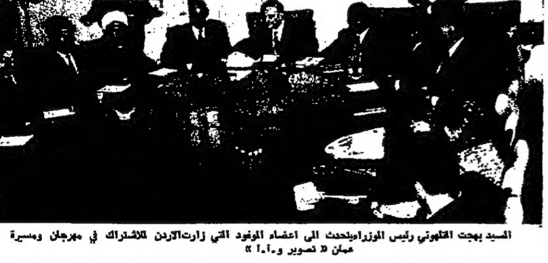
السيد بهجت التلهوني رئيس الوزراء يبحث مع اعضاء الوفود التي زارت الاردن للاشتراك في مهرجان وسيرة عمان

تغازي الحسين بوفاة كندي الى جونسون واولاده لتفقد وتفقيه عمان - بحث جلالة الملك المعظم بالمرقة القابلة الى الرئيس امريكى جونسون ، محزياً بوفاته السناتور روبرت كندي - « فغاية الرئيس جونسون رئيس الولايات المتحدة الأمريكية - البيت الأبيض - واشنغن - هوني نيا وفاة المرحوم السناتور روبرت كندي وعراني منه جن خاص، ان الخضرة يتفقد التي اصابت الضمير امريكى اقبل والمعيد من اصقلته